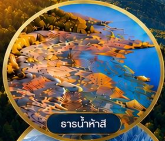
ธารน้ำห้ำสี่