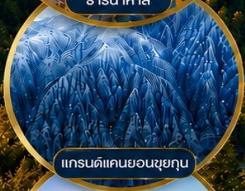
แกรนด์แคนยอนซูยคุน