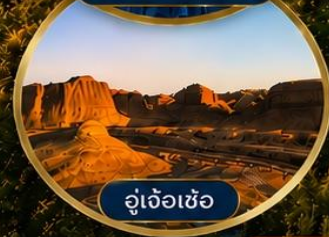
อู๋เจ้อเซ่อ