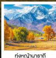
ทุ่งหญ้านาราที

ทัวร์คุณธรรม ไม่ลงร้านช้อปปิ้ง ไม่ขายออฟชั่น