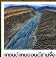
แกรนด์แคนยอนตู้ซานจื่อ