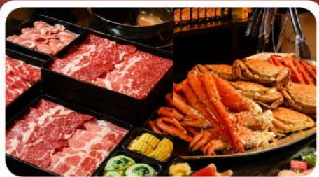
บุฟเฟ่ต์ชาบู ขาปู 3 ชนิด