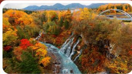
น้ำตกชิราฮิเกะ