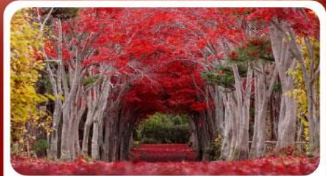
สวนลับชิราโอกะ