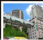
รถไฟกะลุดึก

ภูเขาควงอู๋ซาน (รวมกระเช้า) • อุทยานหมีซางซาน หินแกะสลักหนานคาน • ชมรถไฟกะลุดึก หงหยาดัง • ถนนคนเดินเจี๋ยฟางเป่ย์