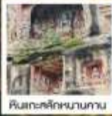
ศิลปะสถาปัตยกรรม