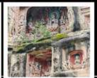
หินแกะสลักหนานคาน

PERIOD 1 : 13 - 17 ต.ค. 2569 PERIOD 2 : 17 - 21 ต.ค. 2569