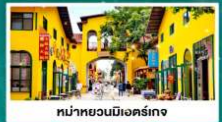
หมู่บ้านมื่อเออร์เกง