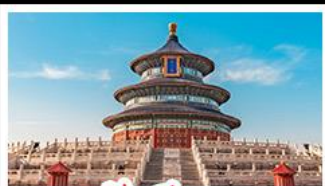
เจดีย์เทียนถาน

พระราชวังต้องห้าม - หอฟ้าเทียนถาน พิพิธภัณฑ์บิรซิงเต่า - ไรไวน์ - วาฬเคียวคาย