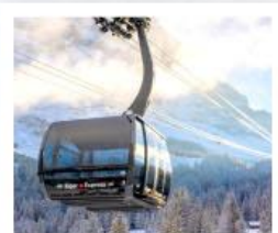
ขึ้นกระเช้ายอดเขาจุงเฟรา