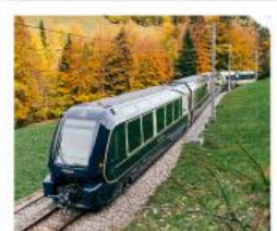
รถไฟโกลด์เดินพาส