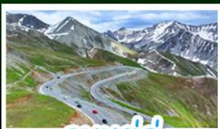
ถนนตุ่กู๋

อุทยานเขี้ยวต้า - ไช่หลี่มู่ คาราจัน - ถนนตุ่กู๋ ตลาดแกรนด์บาซ่า - ทุ่งหญ้าคาราจัน