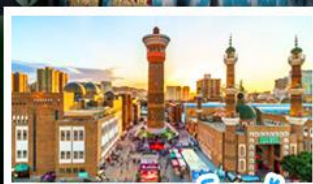
ตลาดแกรนด์บาซ่า