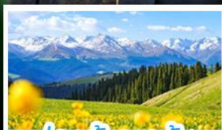
ทุ่งหญ้าคาราจัน