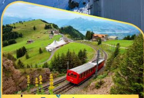
นั่งรถไฟขึ้นสู่ยอดเขาโรติก