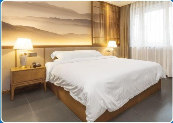
👤 SINGLE (SGL)