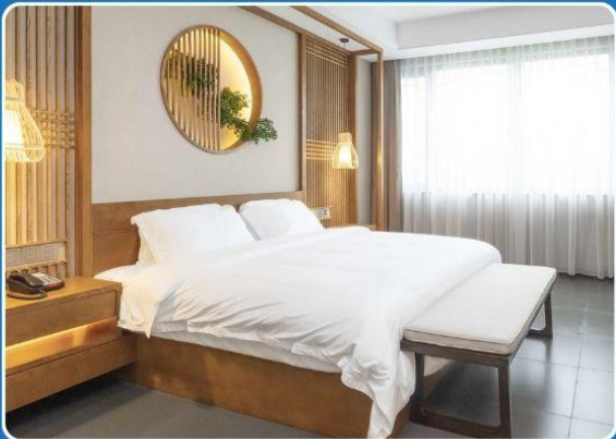
👤👤 DOUBLE (DBL)