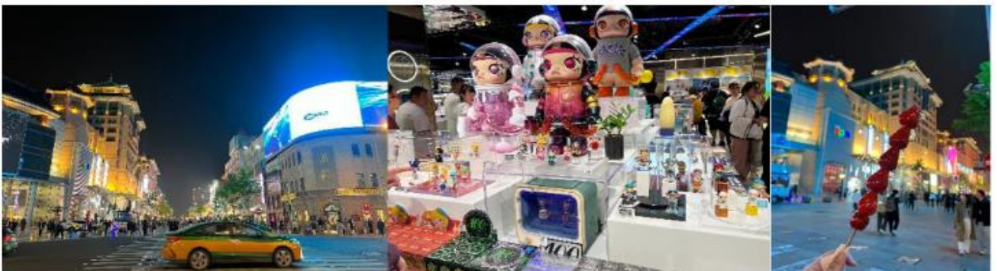
ที่พัก Beijing Henan Plaza Hotel หรือเทียบเท่าระดับ 4 ดาว (มาตรฐานจีน)