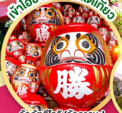
วัดคัตสึโฮจิ (วัดดาร์มูมะ)