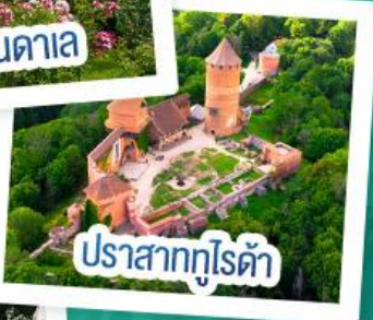
ปราสาทกูโรต้า